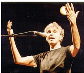
Caetano Veloso in concerto

Il grande interprete il 13 maggio chiuder  in bellezza la sedicesima edizione del festival Abbabula al nuovo teatro comunale