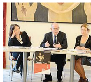
La presentazione del programma

Per tre giorni il cuore della citt  sar  la location di decine di manifestazioni collaterali della festa delle tradizioni sarde