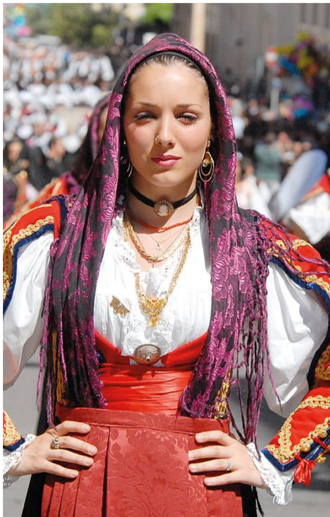
Una giovane donna in costume sfilata alla Cavalcata sarda

Ad aprire la sessione di maggio del Festival sar  la produzione "Un artista oggi: deve morire", pensata e prodotta appositamente per Abbabula dalla scrittrice Giuseppe Rizzo e dal cantautore Lorenzo Urciullo in arte Colapesce (8 maggio). Per i nottambuli del Festival, questa edizione, in collaborazione con l'Associazione The Hor, propone